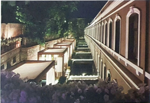
Akaretler Sıraevleri, İstanbul

İstanbul'un iş ve oteller merkezinin kalbine yer alan Akaretler Sıraevleri, 1875'te Sultan Abdülaziz'in emri ile Dolmabahçe Sarayının bir uzantısı olarak saray personeline lojman olarak yaptırılmış. Bu evlerin restorasyonu, şu anki ofis, alışveriş, konut alanları ve W İstanbul Hotel oluşumu ile atıl bir bölgenin yeniden canlandırılmasına öncülük etmiş ve tarihi